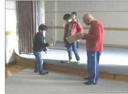
【ふれあい遊びの様子】

3学期になり、子どもたちは地域の方と一緒に囲碁・将棋・リサイクル工作・グランドゴルフ・伝承遊び・卓球等の遊びをする「ふれあい遊び」を、始めました。